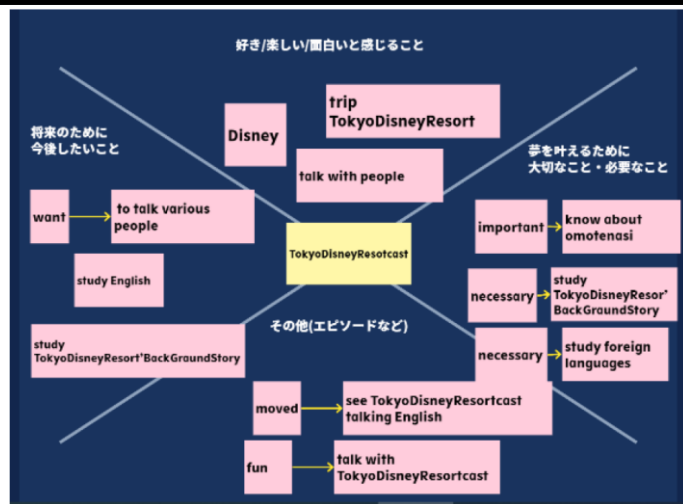
【Xチャートにメモを並べる】