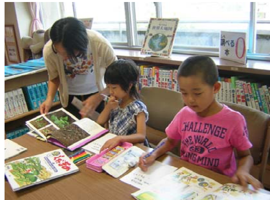
今度は自分で野菜クイズ作り