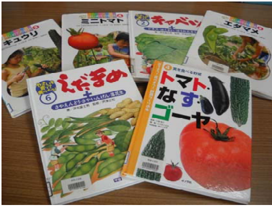
班に配付された野菜に関する図書6冊