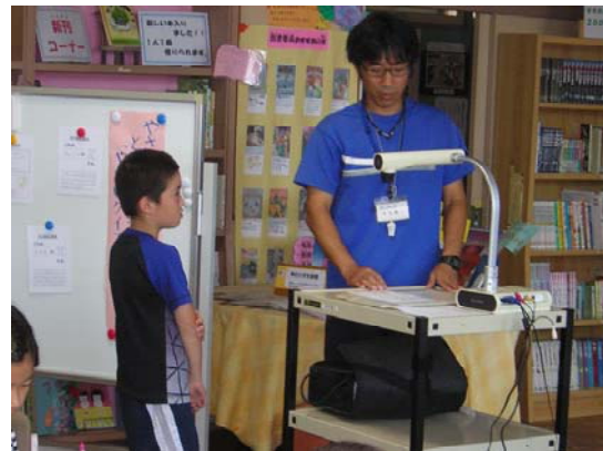
作ったクイズをプロジェクターで発表