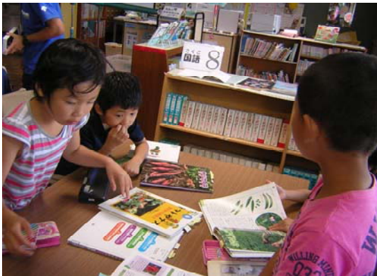
資料で調べてクイズを解く