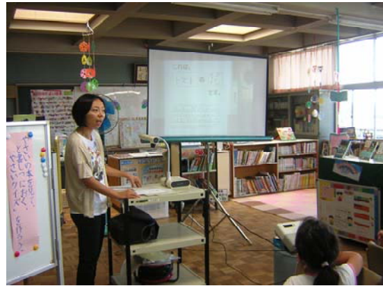
野菜クイズの例題を解いてみよう！