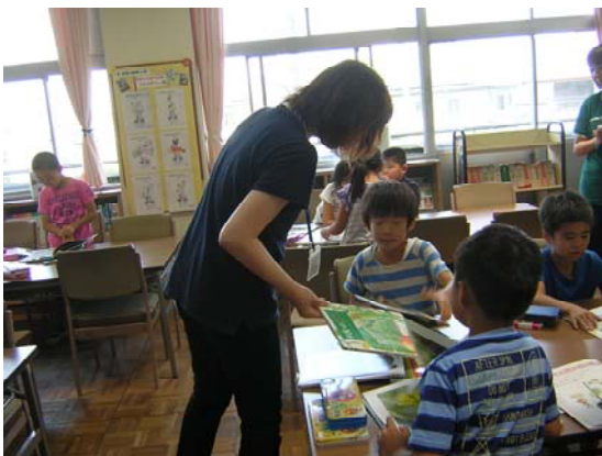
学校図書館指導員のアドバイス