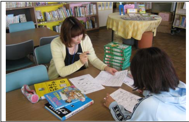
<写真① 図書館従事職員との打ち合わせ>