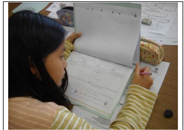
<写真⑥ 読書ノートの記録を活用>