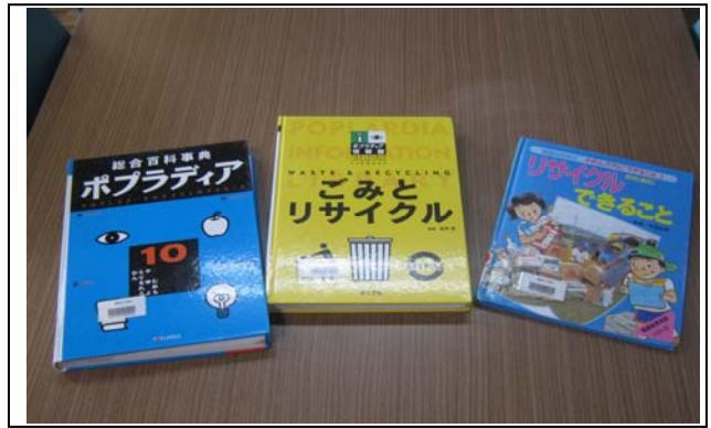
<写真② 使う資料や書籍の確認>