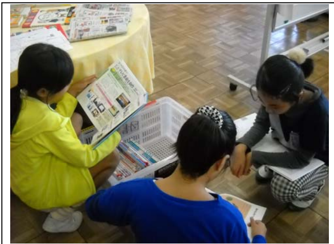
<写真⑤ 自分で資料をさがす児童の様子>