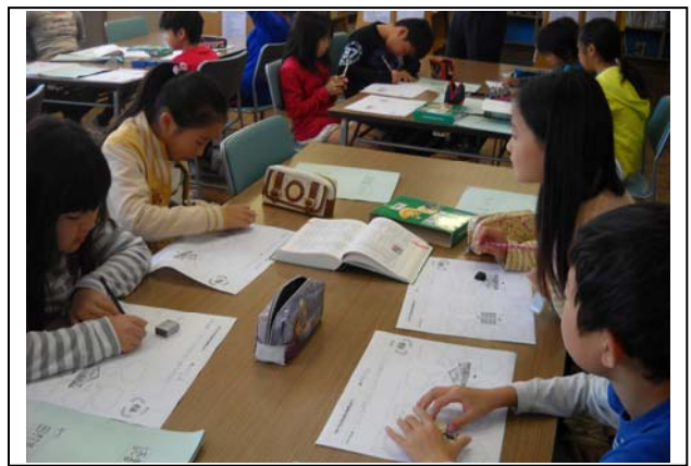
<写真④ 辞書で調べる様子>