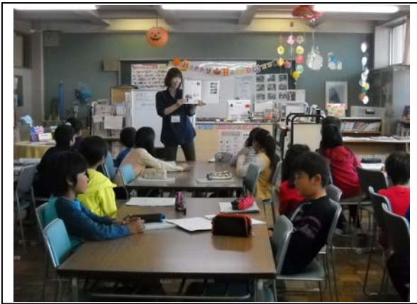
<写真③ 図書館従事職員からの説明>