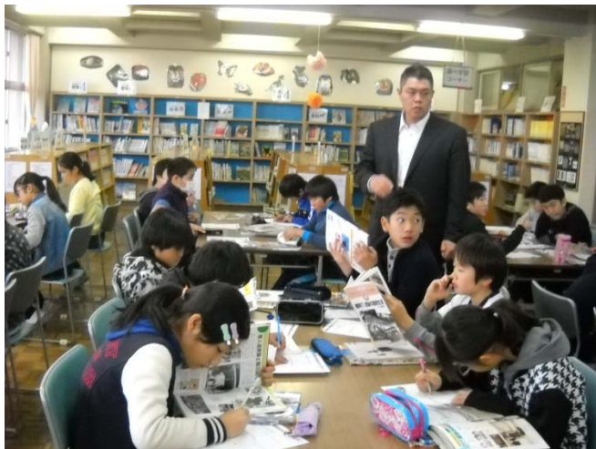
<写真③戦争時代の事について調べているところⅡ>