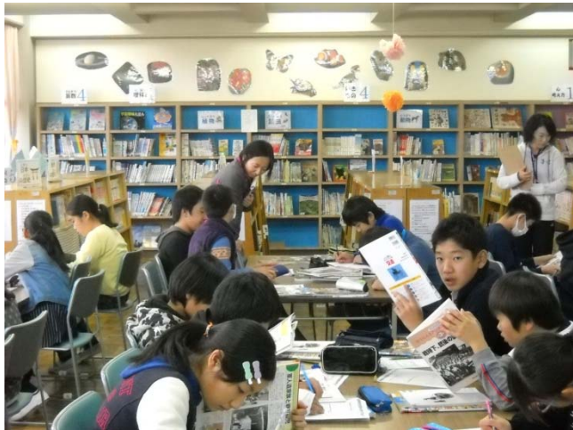
<写真①戦争時代の事について調べているところⅠ>