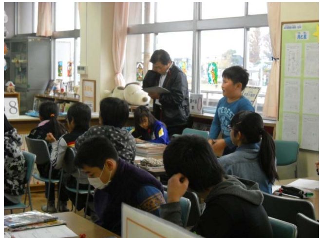
<写真②調べた事を発表しているところ>