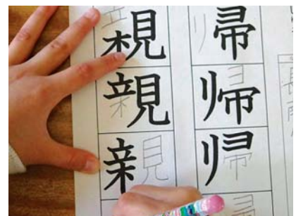
〈漢字のワークシート例〉