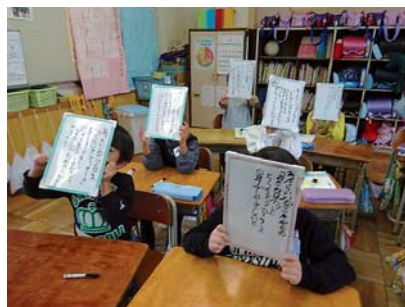
〈ホワイトボードの活用〉