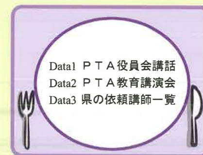
(Package 1) P T A 役員会、全体会等での講話