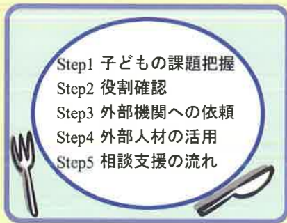
(Package 1) 発達障害等に関する相談