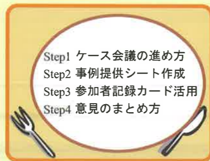
(Package 2) 専門性向上研修