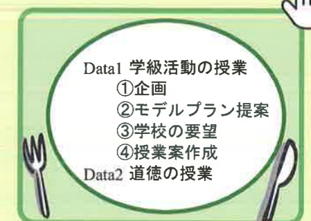
(Package 2) 学級活動や道徳等の授業