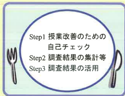
(Package 2) 授業改善の視点