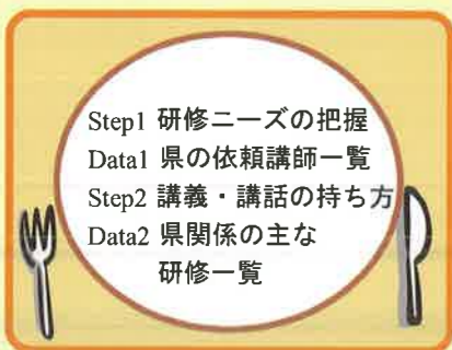
(Package 1) すべての教員対象研修